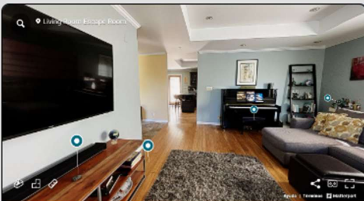
Bienes Raíces Casas